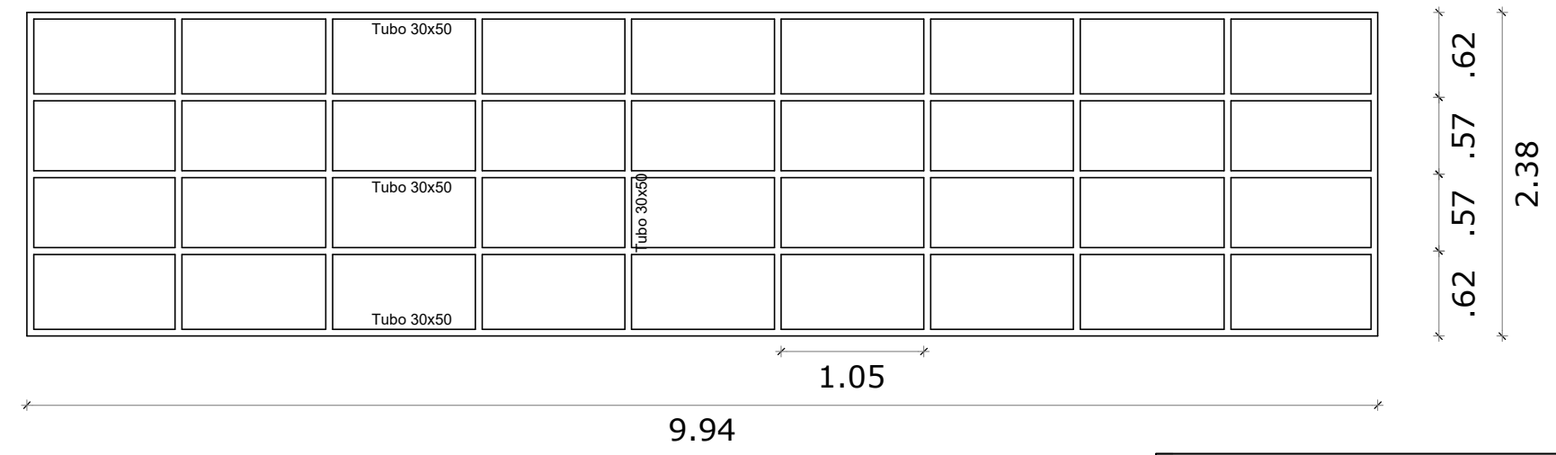
Projção da estrutura metlica